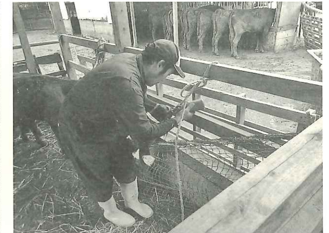
網でしっかり捕まえば、投薬などの作業もしやすくなります